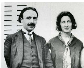
Célestin et Elise Freinet 1896-1966 / 1898-1983