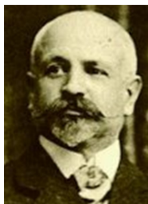
Francisco Ferrer 1859-1909